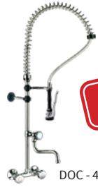
DOC - 4+