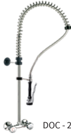
DOC - 2+